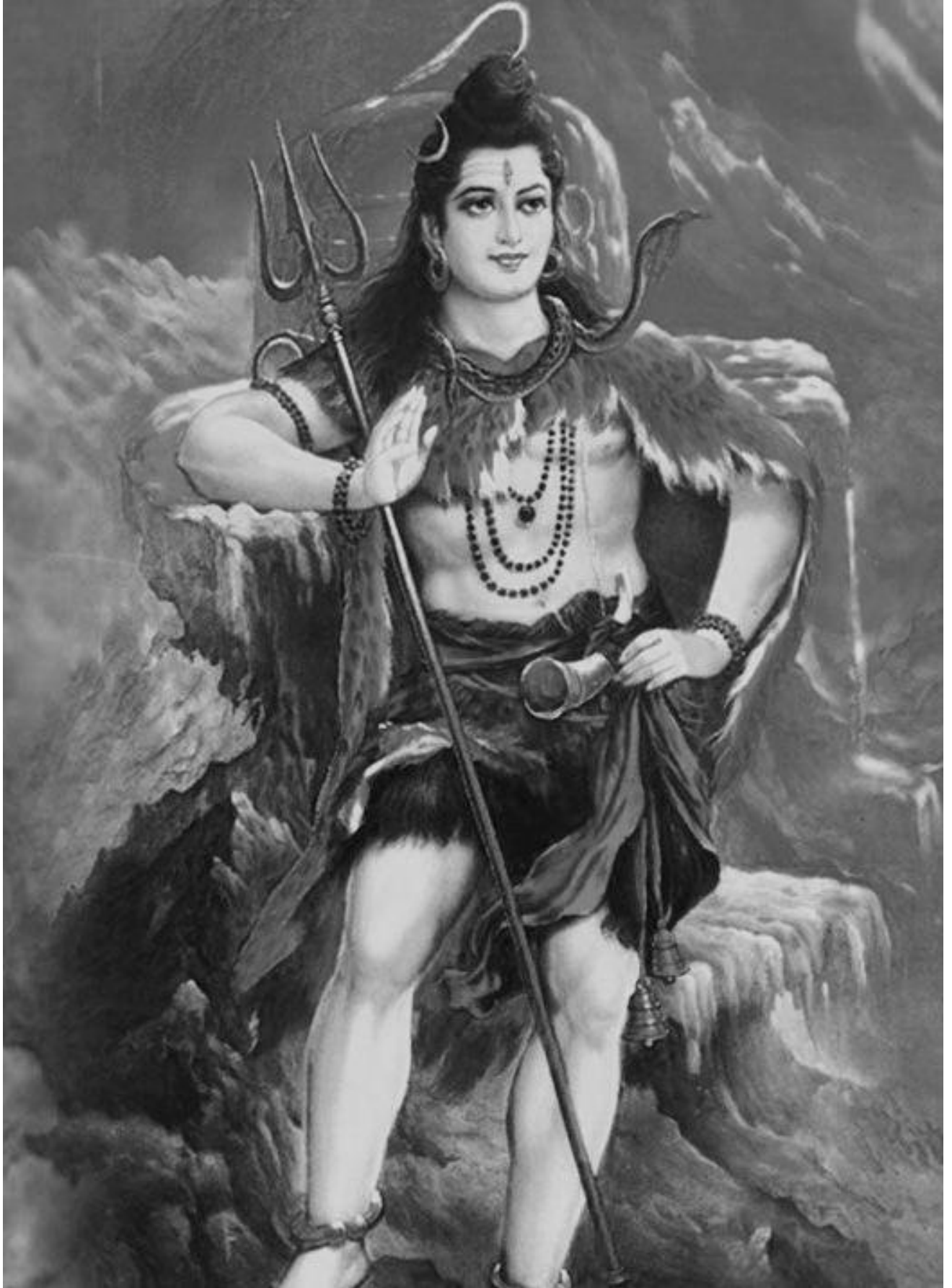
CHINMAYA MISSION DFW – DWADASA JYOTIRLINGA 2011- STOTRAMALA